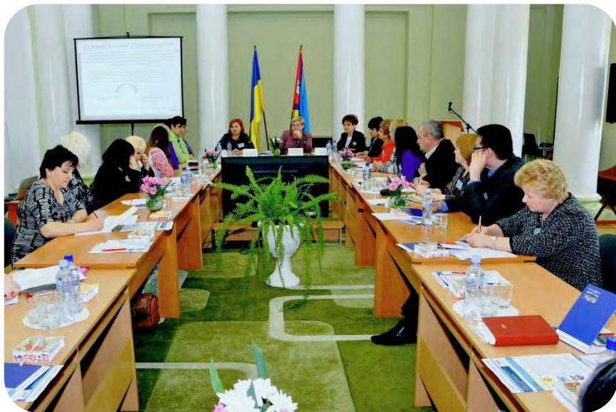
м. Первомайськ (березень 2017 року)

Асоціація міст України СПІЛЬНИМИ ЗУСИЛЛЯМИ