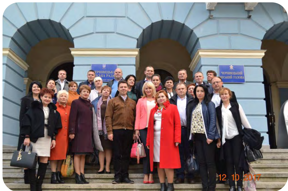
м. Чернівці (жовтень 2017 року)