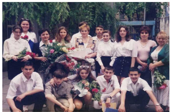
Травень 1998 року. Перший випуск.