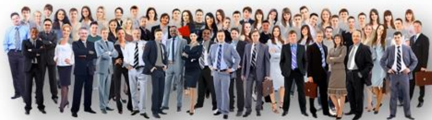
Органи самоврядування працівників закладу освіти